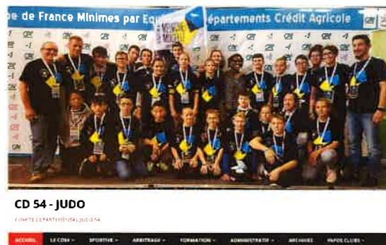
Ancien site internet

Le nouveau site a été inauguré cette saison : les informations y sont plus faciles à trouver, et son design plus moderne le rend plus agréable à visiter ! De plus, vous pouvez désormais y accéder en https ! 😊