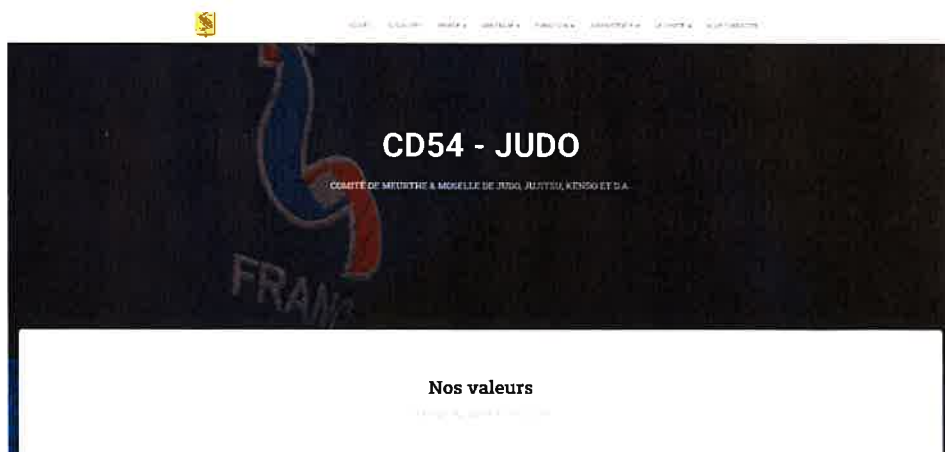
Nouveau site internet